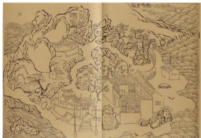
《澳門記略·娘媽角圖》