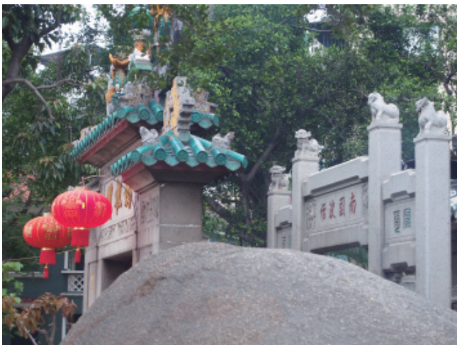
媽閣廟外觀——山門與牌坊