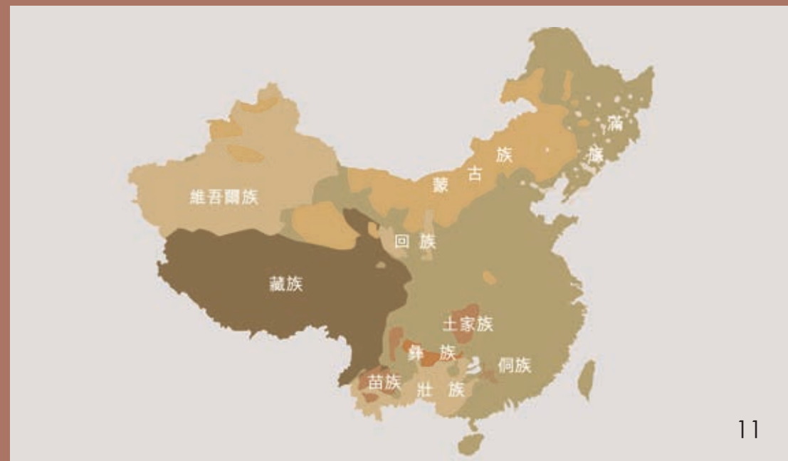
● 中國主要少數民族分佈圖

中國有 56 個民族，其中漢族佔了人口 91% 以上，56 個民族則合稱中華民族。