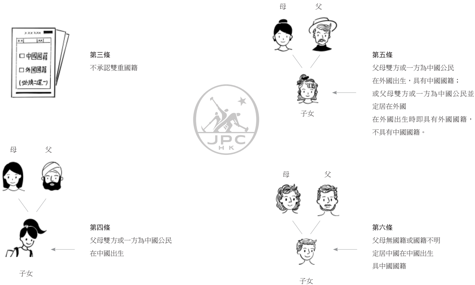
圖二：《中國國籍法》的國籍身份規定