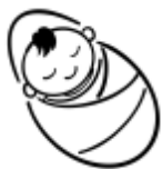
圖一：《基本法》第 24 條對香港特區永久性居民的規定