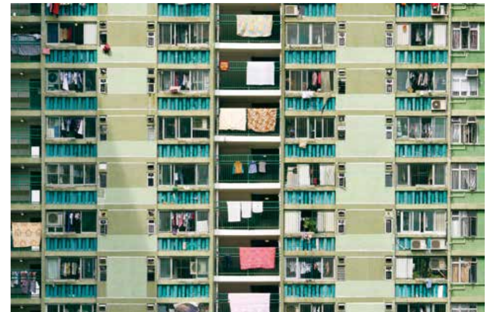
上：2016 / 瀝源 中：2009 / 南山 下：2016 / 美林