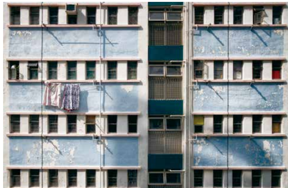
上頁：2014 / 順利 上：2015 / 大窩口 中：2006 / 華富 下：2015 / 漁光