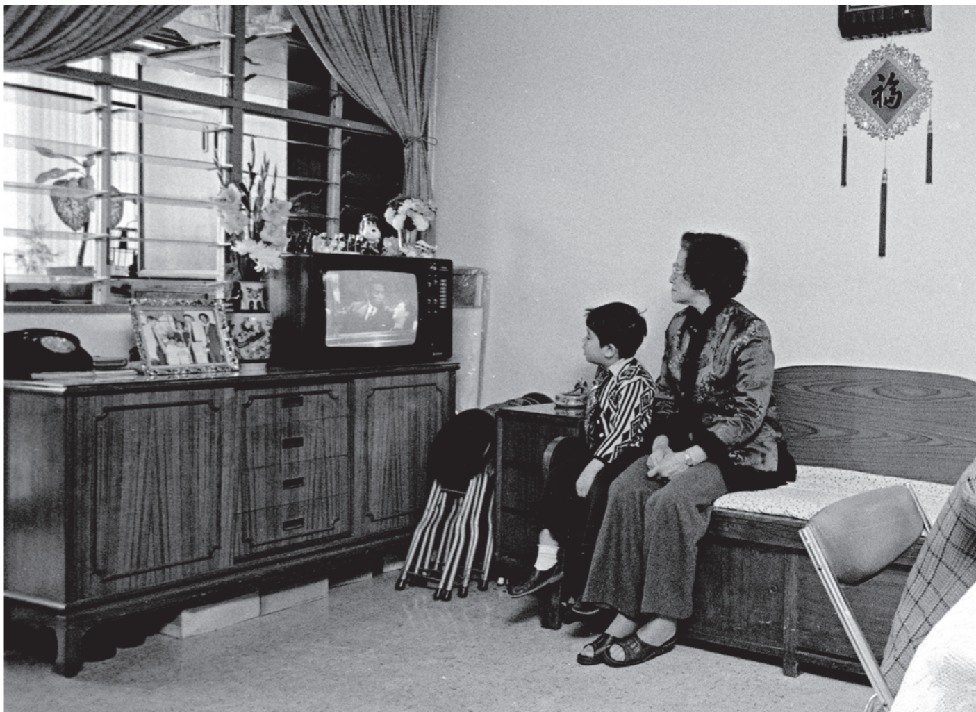
早期的電視劇題材貼近現實生活，使得香港大眾市民能產生共鳴。（照片攝於一九七九年）

眾媒介已大不如前，加上新媒體的湧現，令新一代年輕人有更大自主性去選擇合適的時間來收看節目，這無疑大大削弱了無線電視作為昔日主流媒體的角色。雖然這樣，無線電視在一眾免費電視台中仍然是領導者，每年仍然製作出大大小小不同類型的電視節目給觀眾。相比以往，電視節目也走向更專業化的製作，電視台也樂意將每個節目包裝成市場產品以大力宣傳。而電視節目標題字的出現，也有助強化節目品牌和發揮推廣作用。