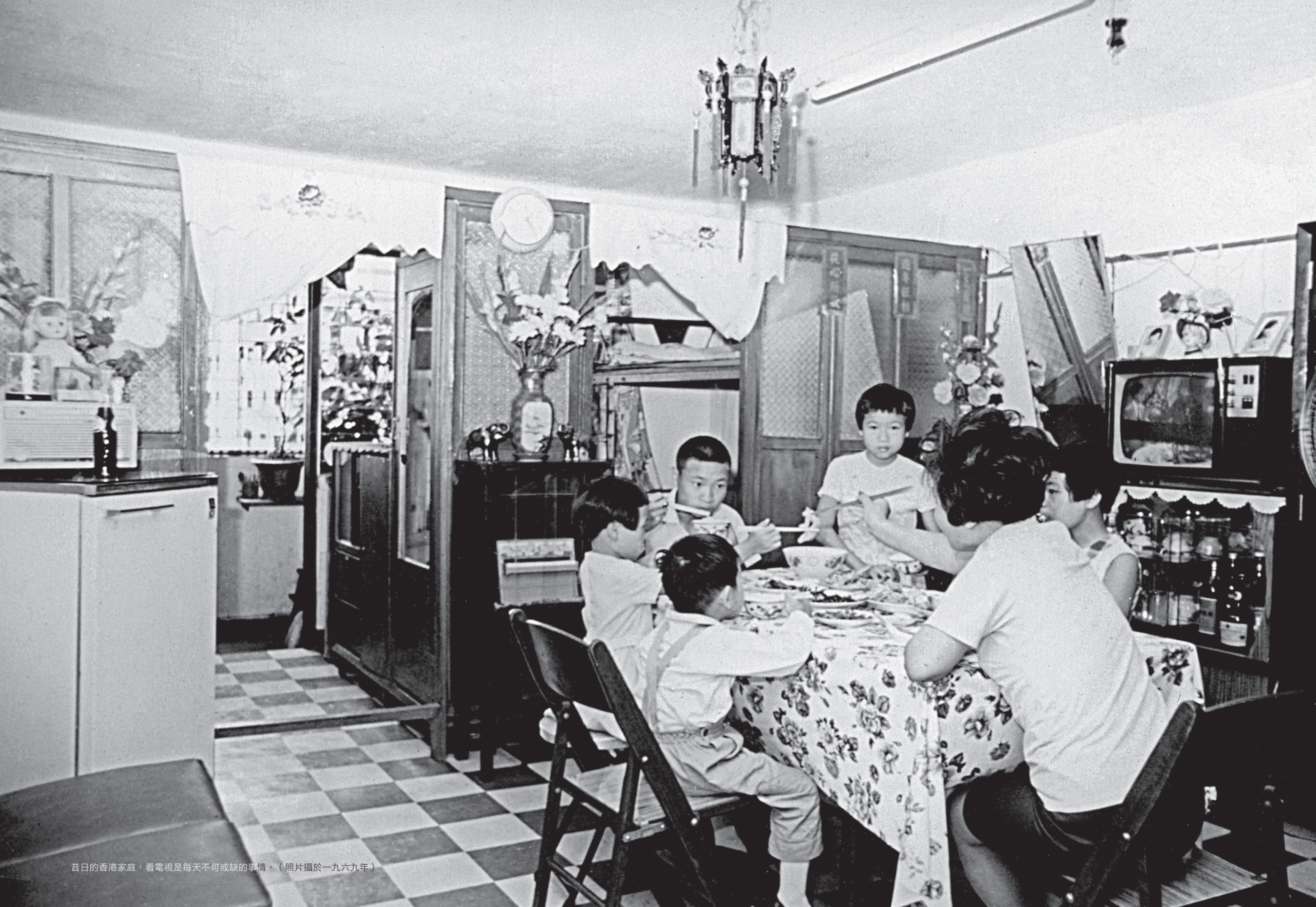
昔日的香港家庭，看電視是每天不可或缺的事情。（照片攝於一九六九年）