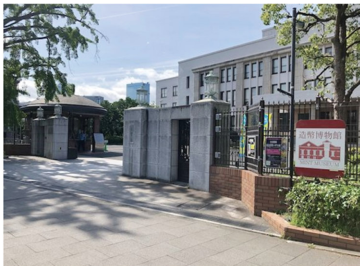
大阪造幣局舊址（今造幣博物館）