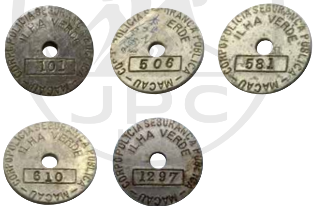
在葡兵駐守青洲山年代，當地居民向葡萄牙人申領出入紙或圓銚牌（直徑 4.5cm，厚 2mm），這是其中部分圓銚牌