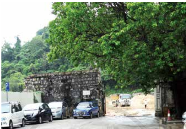
青洲山麓有地盤要發展，圍牆被拆除，原有兩米多高、半米厚