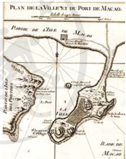
1764 年巴黎印製的澳門航海地圖，清晰看到青洲島與澳門的距離