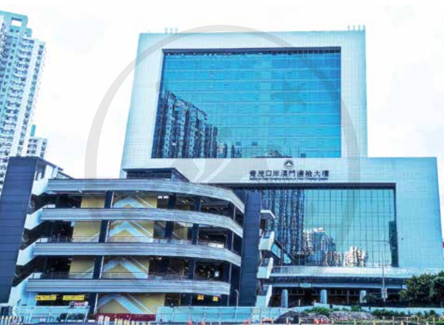
2021年9月8日啟用的青茂口岸