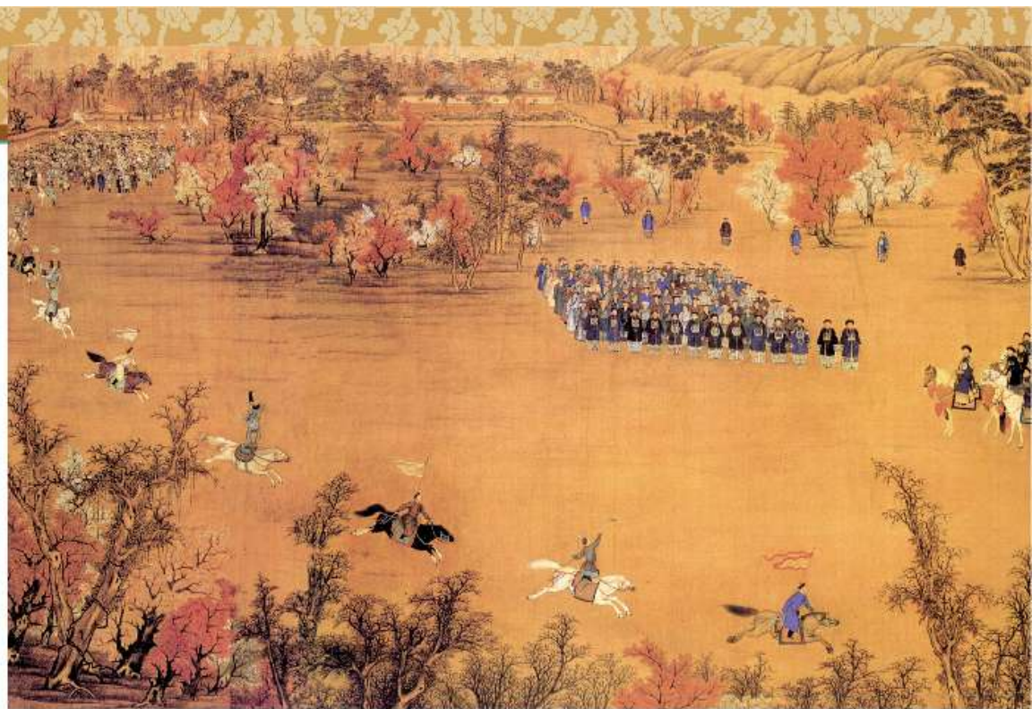
馬術圖 清 郎世寧 郎世寧（一六八八～一七六六年），義大利人，康熙年間來到中國，成為宮廷畫師。此圖反映了清前期八旗兵尚武的狀況。

極參照明朝體制設立六部，每部由「管部大臣」主持，下設「承政」（尚書）三人，分別由女真人、蒙古人和漢人擔任。皇太極並仿效明制設立都察院，又創設蒙清理藩院，專門處理民族事務，形成內三院、六部、都察院和理藩院，所謂「三院六部二衙門」的政府架構，基本完善了政府組織體制和結構。