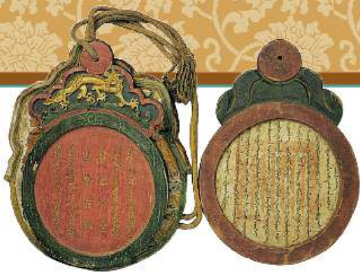
皇太極調兵木信牌