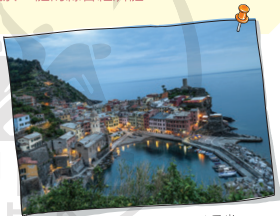
意大利雷焦艾米利亞城鎮風光

自由貿易港（Free Trade Port）是指設立在一國或地區境內、關境之外的特殊經濟區域，通過免除關稅、放寬監管、開放市場等制度設計，實現貨物、資金、人才等要素自由流動的開放平台。自由貿易港簡稱為自由港或自貿港。