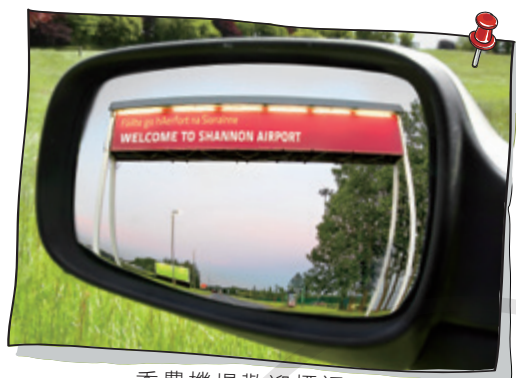
香農機場歡迎標語