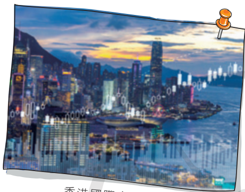
香港國際金融中心

在全球貿易的壯闊版圖上，自由貿易港、自由貿易園區、自由貿易試驗區與自由貿易區等多元開放形態，宛如星羅棋佈的活力節點，持續重塑著國際經濟的流動脈絡與發展格局。它們因地域稟賦、歷史積澱與政策導向的差異，既共