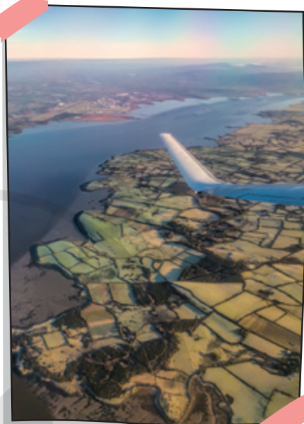
香農機場附近景觀鳥瞰圖

園區主導產業多元，涵蓋航空運輸、租賃及相關服務，以及通信技術研發、工程技術設計與組裝、國際金融及財務服務、國際物流服務與管理等。此外，製藥、食品加工、電子及機械設備等製造業也在此蓬勃發展。