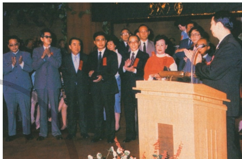
1984 年，世界貿易中心協會在中國設立的第一個會員組織開幕，其辦公室就在金陵飯店。

首名來飯店視察的中國國家領導人是廖承志。1983 年，他到訪後十分滿意，題辭「金陵飯店好」。同年，時任總書記胡耀邦到訪並題詞「友誼傳世界，豪情看神州」；他曾在這裡會見意大利共產黨總書記。1985 年，鄧小平來視察，稱讚金陵飯店「管得很好」，並囑咐當時上海市官員來學習，後來官員亦真的來訪。《新華日報》寫下，金陵飯店是「改