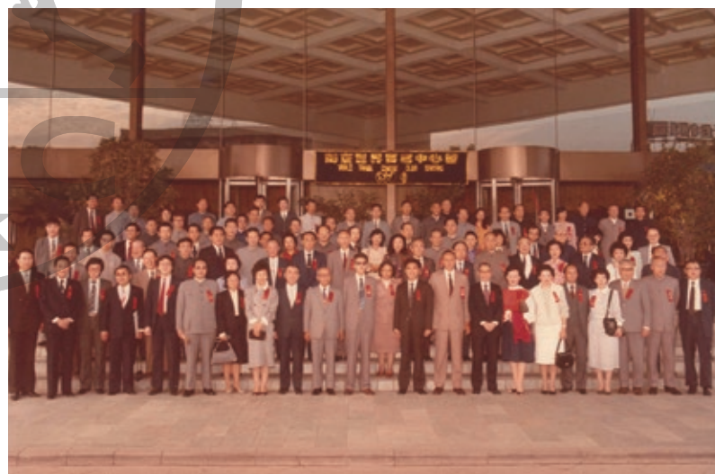
1997 年，南京世界貿易中心開幕。