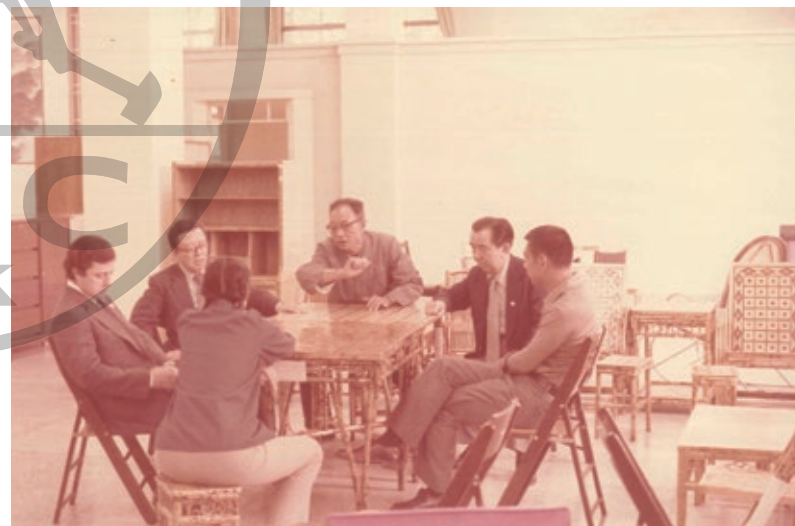
1978年，在南京召開金陵飯店的籌備會議。