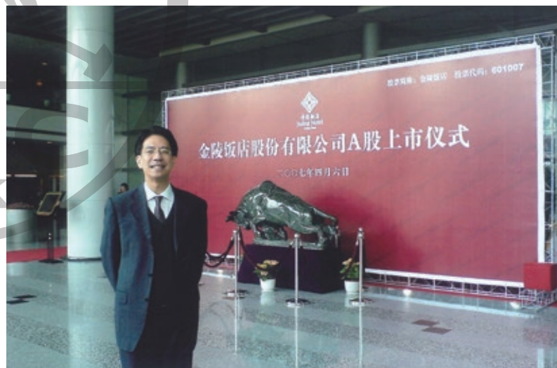
2007年，金陵飯店A股上市，陶氏家族被邀成為小股東。