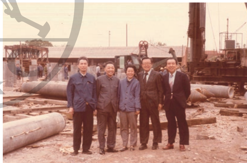
1980 年代初金陵飯店建造期間，陶氏兄弟（右一、右二）在地盤上合照。