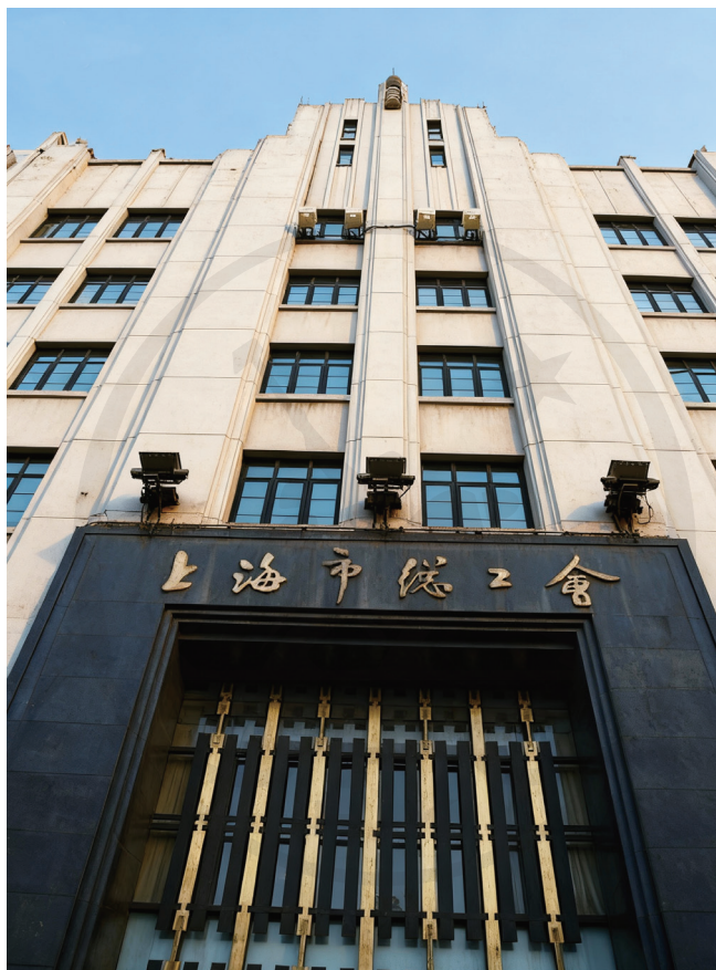
寶順洋行舊址（現為上海市總工會大樓）