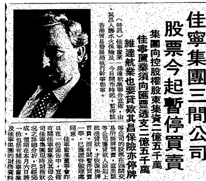
佳寧集團三間公司突然停牌，是日後連串案件的伏線（《工商日報》，1983 年 1 月 3 日）。

其實裕民財務的母公司較早前已察覺香港分部有異常借貸，故於 1982 年 11 月派渣利到香港調查，想不到他卻於 8 個月後被殺。由於疑兇被捕後稱自己是受威迫才協助棄屍，真兇是陳松青僱用的殺手，令陳松青被列作重點調查對象（鄭宏泰、李潔萍，2024）。 3 正如上一章提及，在香港這個高舉自由市場的重商社會，法例尊重私人財產與私人企業營運，保障亦較多，令警方調查商業罪